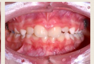
Dopo la correzione