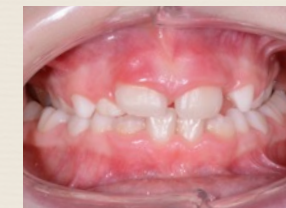
Morso crociato bilaterale

Quando il palato è molto stretto i denti dell'arcata superiore chiudono all'interno rispetto ai denti inferiori mentre dovrebbe essere il contrario (l'arcata superiore è come il coperchio della pentola, deve essere più ampia). In alcuni casi il morso crociato è solo da un lato, quasi sempre a causa di contatti che fanno scivolare la mandibola da un lato quando il bambino chiude la bocca alterando la funzione masticatoria.