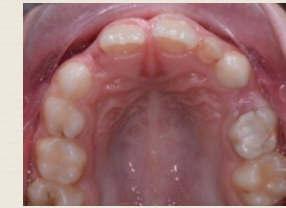
Palato stretto con poco spazio per gli incisivi

Si ha quando la mascella, cioè l'osso che porta i denti superiori, si sviluppa poco in larghezza. Si accompagna a una riduzione dello spazio per far spuntare correttamente i denti permanenti, solitamente gli incisivi laterali.