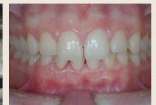
Eruzione normale dei canini dopo l'espansione