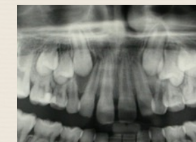
Inclinazione anomala dei canini permanenti

Studi scientifici (McNamara e Baccetti) e l'esperienza clinica hanno dimostrato come l'espansione del palato (anche senza palato stretto) associata all'estrazione di alcuni dentini da latte migliora la possibilità che i denti permanenti che si stanno formando storti nell'osso possano spuntare da soli in bocca.