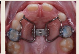
Dopo la correzione